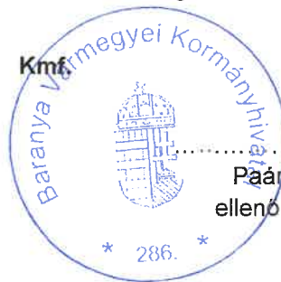
Tökli Éva aljegyző